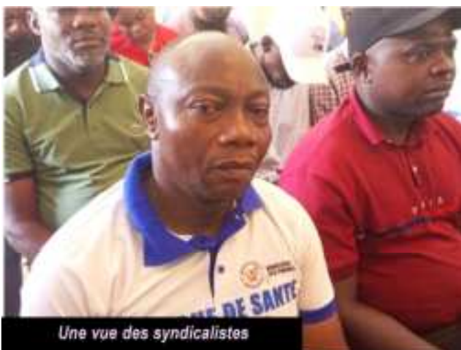
Une vue des syndicalistes