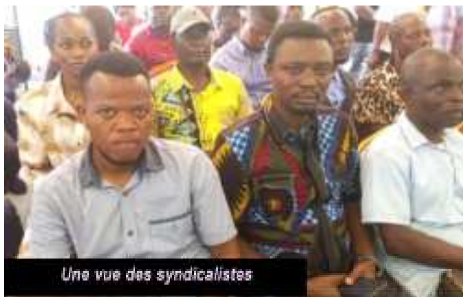
Une vue des syndicalistes