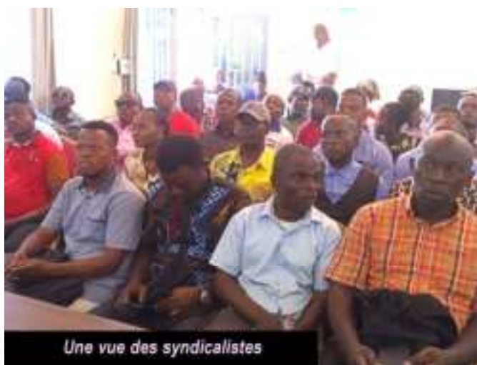
Une vue des syndicalistes