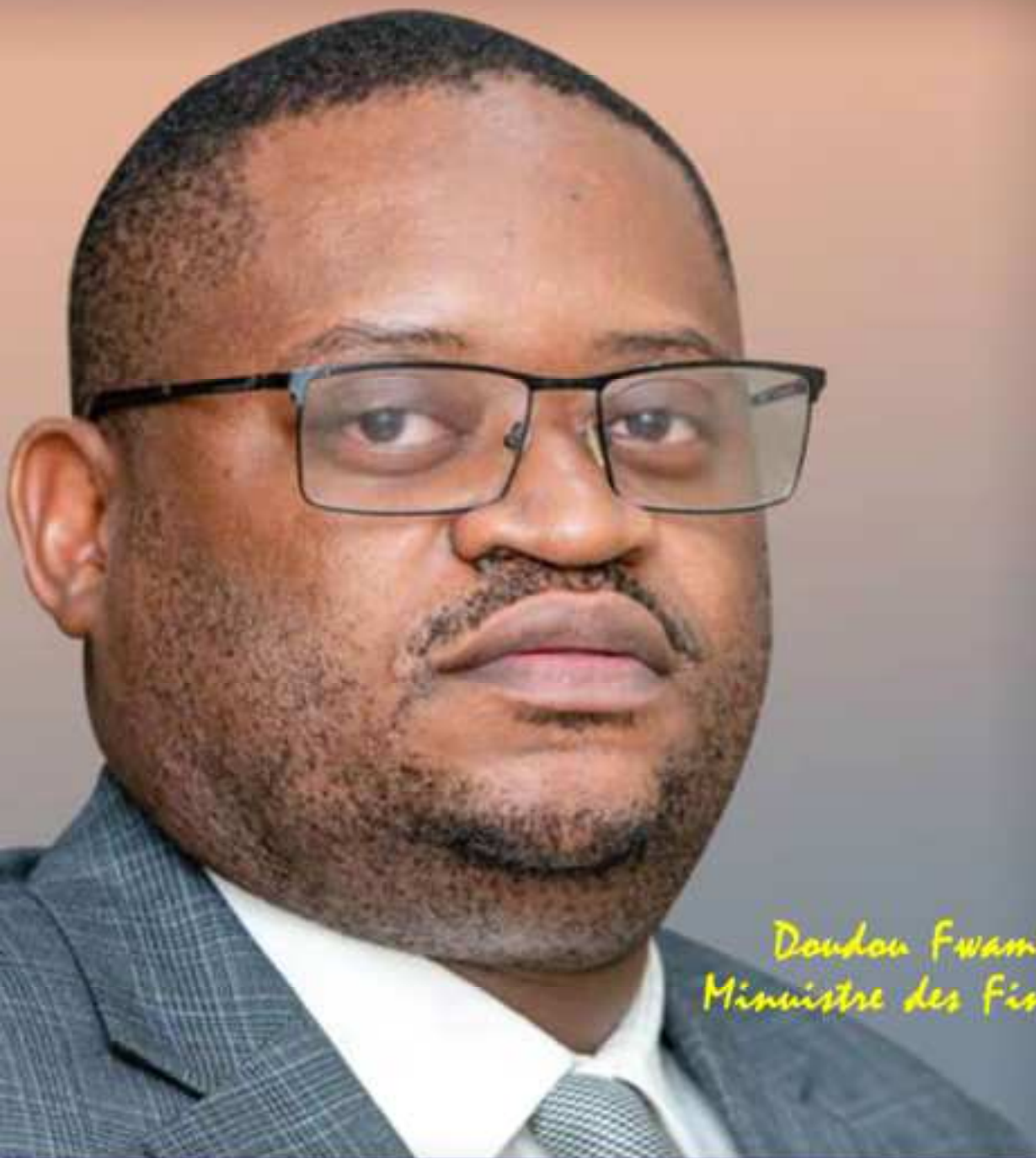
Doudou Fwamba Ministre des Finances