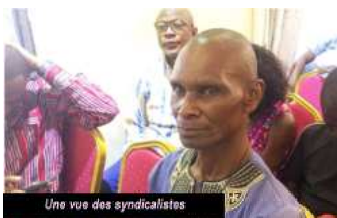
Une vue des syndicalistes