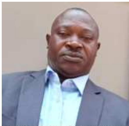
Tengenez Cicura S.G.A des finances et patrimoine